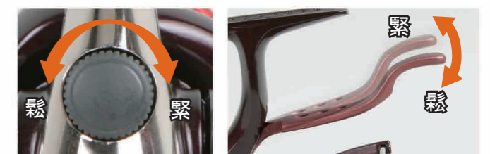
煞車拉柄間隙微調鈕