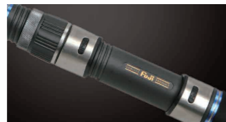
■ 搭載富士輪座附加防鬆環