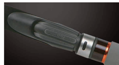
■ 槍柄/直柄皆搭載富士輪座

近年來輕便的近海娛樂船釣發展迅速，且不斷吸引新血加入陣容；Okuma推出輕便且實用的-RELAXY「銳雷斯」輕鐵板路亞竿。「銳雷斯」可承載40g-120g的輕量鐵板，超黏力的白色竿先忠實傳遞釣組狀況，讓釣者不漏失咬餌與敲底訊息；採用可以放心使用PE線的富士防纏K導環，單節式竿身輕量與力量並具，在操竿搏魚時動能完全傳遞，輕鬆感受滿弓的極限狀態。有極佳的抗UV處理、不易脆化，竿尾軟質EVA握把提供絕佳彈性與觸感，令熱愛釣魚的您盡情享受釣竿揮舞的樂趣。