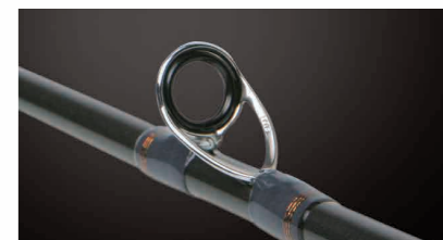
■ 全機種採用Fuji K系列防纏導環

■ 搭載富士ACS直柄/VSS直柄捲線器座 ■ 採用富士不鏽鋼防纏K導環 ■ 竿先白色塗裝忠實傳遞釣組狀況 ■ 分段式EVA防滑握把 ■ 高質感鋁合金節環 ■ 附潛水布竿袋